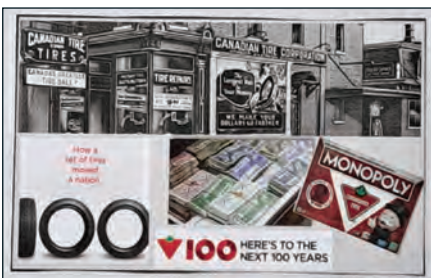
Quelqu'un a assemblé ce petit collage. Probable- ment des images d'internet qui ont été laminées avec un plastique transparent. Rose Van Sickle l'a montré aux membres lors de la réunion de l'ONA.