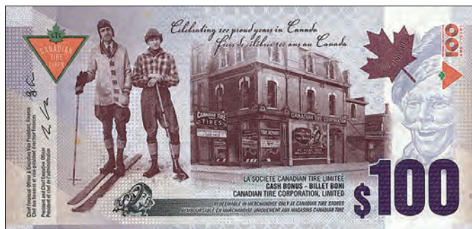
CTC S35-H22 devant

par Jerome Fourre - CM0000120 - jerome4e@gmail.com