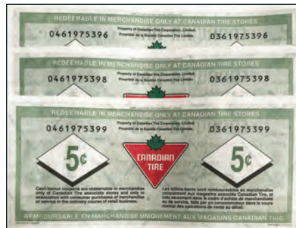
S30-B09-03 - avec des numéros de série incom- patibles Envoyé par Bill Cuff