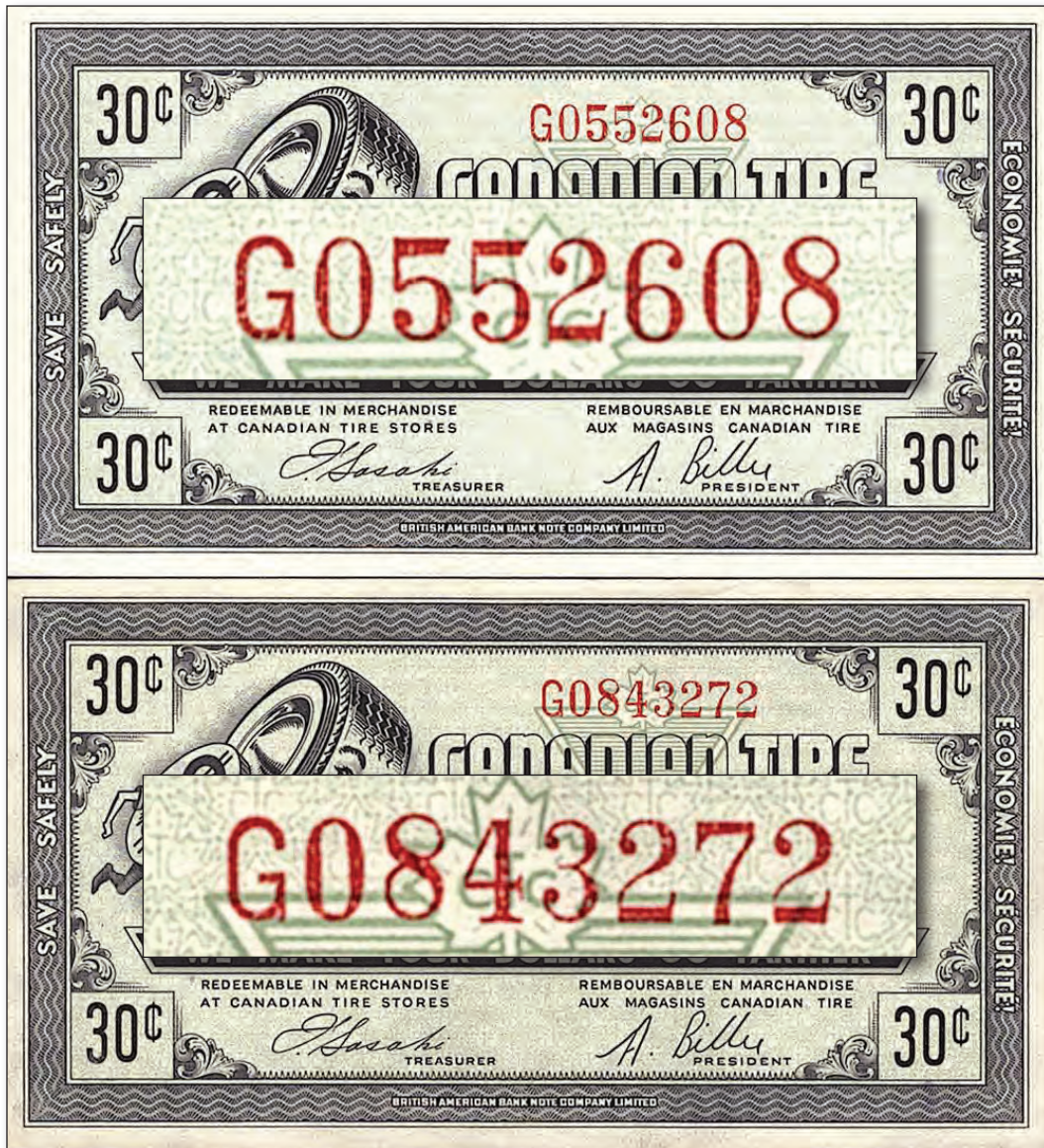
Deux billets G07-F-G1 - 30¢ "mince"

J'ai récemment acquis le billet de 30¢ en haut. Lorsque je le plaçais avec l'autre billet de 30¢ de ma collection, j'ai remarqué que le numéro de série était beaucoup plus mince que mon billet d'origine.