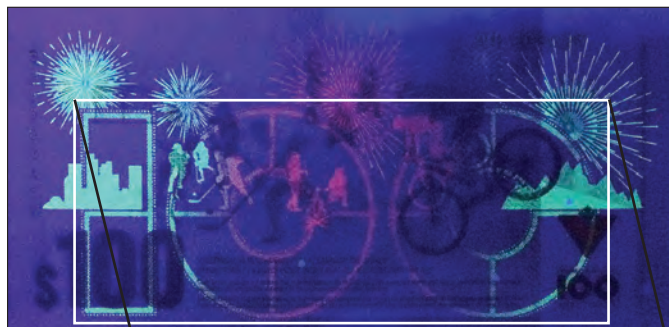
CTC S35-H22 l'endos sous une lumière noire