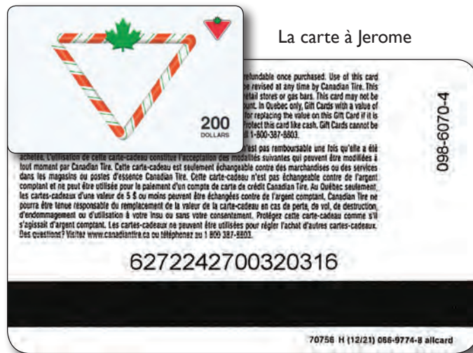
La carte à Jerome

Comme nous le savons, toutes les cartes FA04 "Candy Cane" suivent le même format en ce qui concerne les numéros de série. Toutes les cartes à $25,00 ont les quatre chiffres après les 6272 numéros initiaux, 2424 comme gamme. Les cartes à $50,00 ont 2425 comme gamme. Les $100,00 ont 2430 comme gamme et les $200,00 avaient 2431 comme gamme.