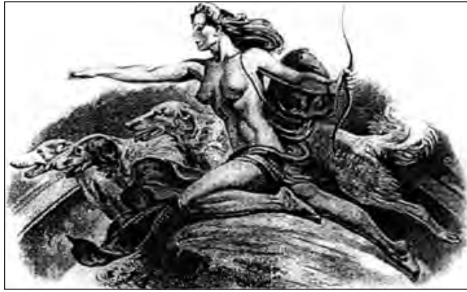
Figure 2: H.R gravure de Dawson "Diana et ces chiens"

McTire sur les coupons Canadian Tire est similaire à celle des divinités et des personnifications au revers des pièces de monnaie romaines. (Sur une pièce de monnaie romaine, Sandy McTire serait Frugalité, la personnification de l'épargne, et son attribut serait le tam-o'-shanter.)