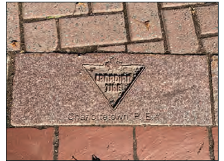
Collecte de fonds pour un parc à Charlottetown, Île-du-Prince-Édouard. CT a contribué.