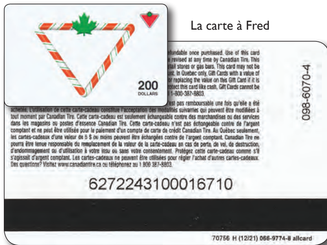
La carte à Fred

En tant que collectionneurs, nous prenons ces cartes en pensant que nous obtenons une carte 0721 comme indiqué au dos de la carte dans le coin supérieur gauche, mais à notre grande surprise, lorsque nous ouvrons le paquet, la carte-cadeau réelle est une 0222 et non une carte 0721 comme prévu.