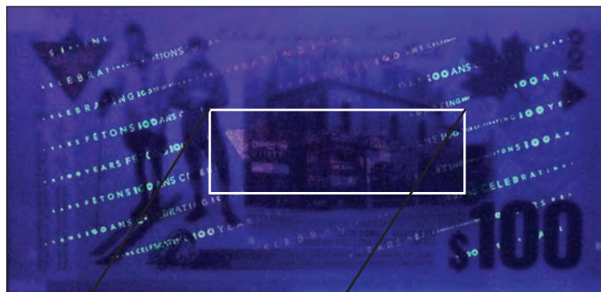
CTC S35-H22 devant sous une lumière noire