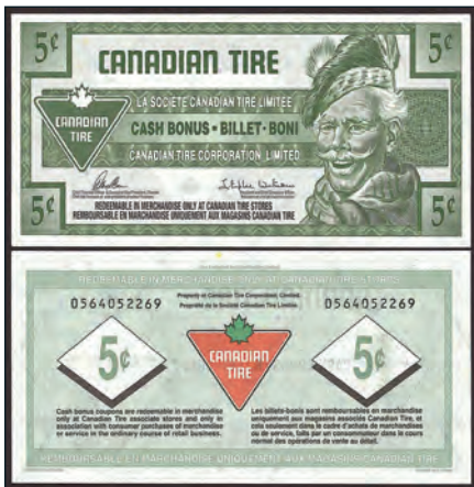
S32-B19-05 numéro de série le plus élevé Envoyé par Bill Cuff