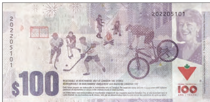
CTC S35-H22 l'endos